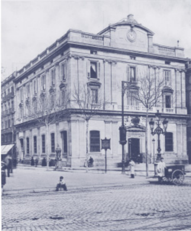
Façana del Banc de Barcelona, [1894].

començà una àmplia activitat inversora basada en la compra de les grans quantitats de diner estranger que entraven al país i en la inversió en alguns dels negocis que nasqueren en aquells anys de creixement.