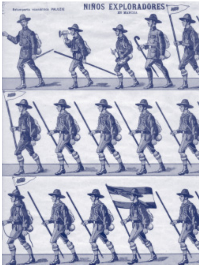
Niños exploradores de Marcha. Soldats. Làmina núm. 879.

anomenats escoltisme i guiatge , presentar a la opinió pública i als seus membres la realitat d'un escoltisme i un guiatge units dins de la seva diversitat d'opcions i recollir i coordinar totes les qüestions d'interès comú. La FCEG organitza campaments, marxes, xerrades, conferències, reunions, cursos de formació, activitats a l'aire lliure, etcètera. Com a òrgans de govern té l'Assemblea General, el Consell General, el Consell Permanent i el Consell Responsable. Està representada en la Federació d'Escoltisme a Espanya i en el Comitè d'Enllaç del Guiatge a Espanya.