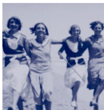
Noies vora el mar durant l'acte de restabliment del nom Vilamar a les colònies escolars de Calafell (17 de juliol de 1930).

visualització dels documents descrits, sigui documentació textual o no textual (fotografies, mapes, cartells, plànols i d'altres). Aquest objectiu ha comportat la digitalització de fons que, un cop associats a la descripció, en permetrà la consulta ràpida i completa tant a la sala de consulta com per via telemàtica.