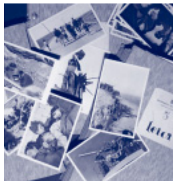
Àlbums i postals del Comissariat de Propaganda Política. Fons Generalitat de Catalunya (II República).

Des de fa uns quants anys, l'Arxiu Nacional de Catalunya té, entre els projectes principals, ampliar la difusió dels fons que conserva per tal de facilitar-ne la consulta als investigadors i a tot el públic. Per aquest motiu i comptant amb les possibilitats que ens ofereix la tecnologia, ja és possible la consulta per Internet de les unitats de catalogació dels fons tractats i d'aquells a què es pot accedir lliurement. Tot i això, el projecte, molt més ambiciós, també inclou la possibilitat d'accedir a la