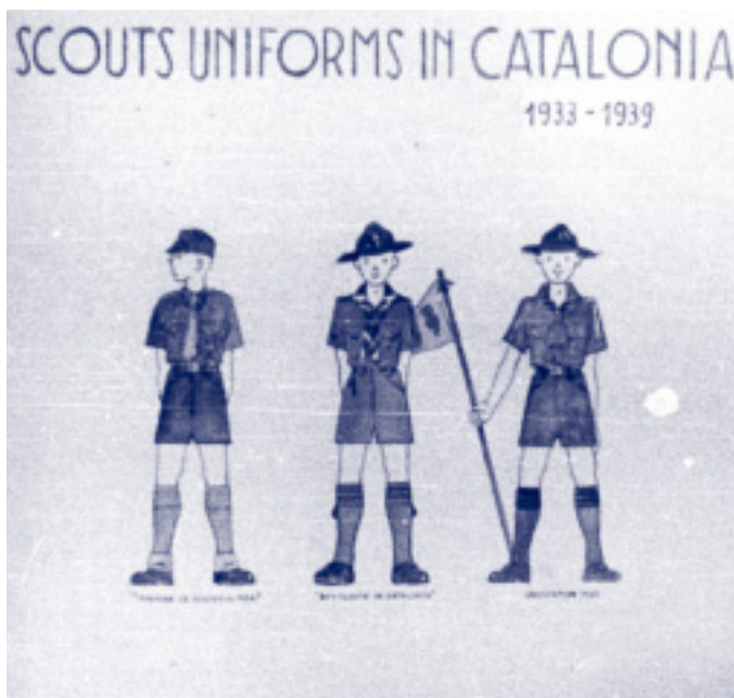
Jamboree d'Àustria, 1951. Uniformes scouts de Catalunya entre 1933 i 1939.

col·locar al costat de la cinta de la bandera espanyola la de les quatre barres.