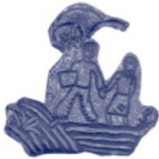
Planxa de linoèum i la impressió que s'hi va fer corresponents a un quadern fet pels alumnes del grup Cadí (1934).

Com és sabut, la línia pedagògica d'aquesta institució pretenia una formació integral que incloïa una sèrie d'activitats poc habituals a les escoles, entre les quals hi havia la iniciació a diferents oficis aprofitant els coneixements impartits entre les matèries més típicament escolars. En va resultar l'aprenentatge de tècniques de gravat i d'impressió en què es plasmaven, a més, les habilitats d'escriptura, dibuix, etc. Un dels fruits que donà aquesta pedagogia va ser la construcció d'un obrador d'impremta que havia de permetre l'edició d'obres escrites, il·lustrades, impreses i relligades pels alumnes mateixos.